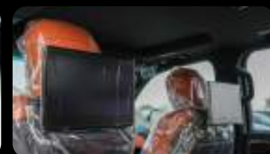
Sistema de Infoentrenimiento Trasero