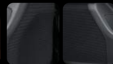
Parlantes Mark Levinson