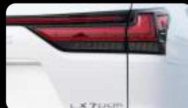
Luz trasera LED