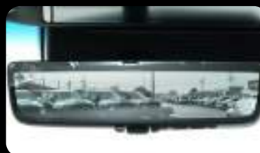
Espejo Retrovisor DIGITAL