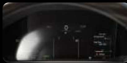
Panel de instrumentos digital