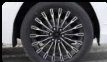
Rines de aleación de 22" pulgadas