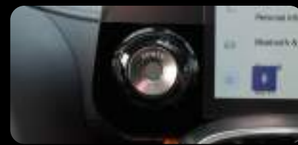
Botón de arranque