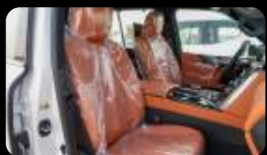
Vista de los asientos delanteros