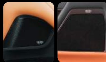
Parlantes Mark Levinson