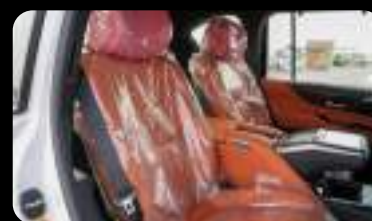
Vista de la segunda fila de asientos