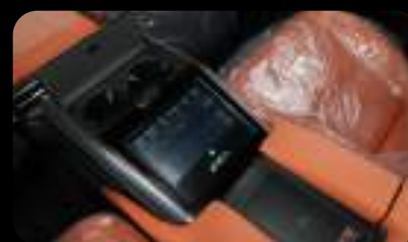
Pantalla de control trasera y cargador inalámbrico