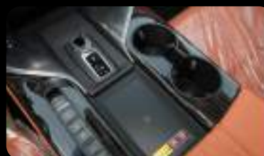
Palanca de cambios, cargador inalámbrico y botones de control