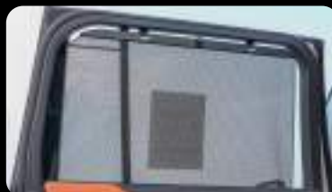
Cortina de la ventana trasera