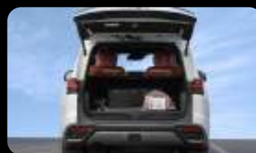
Compuerta trasera eléctrica