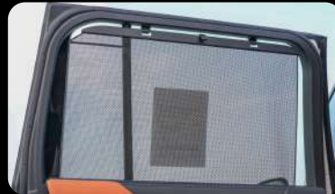
Cortina de la ventana trasera