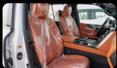
Vista de los asientos delanteros