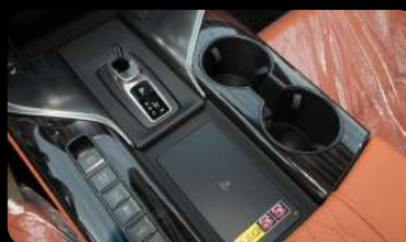
Palanca de cambios, cargador inalámbrico y botones de control