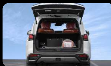
Compuerta trasera eléctrica