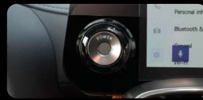
Botón de arranque