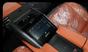
Pantalla de control trasera y cargador inalámbrico