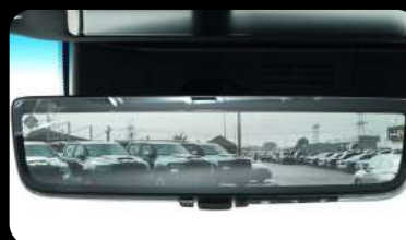
Espejo Retrovisor DIGITAL