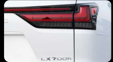
Luz trasera LED