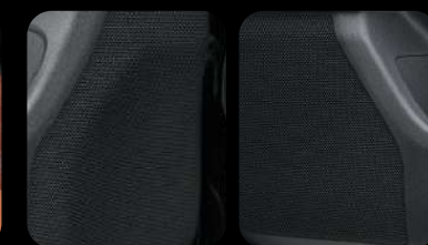
Parlantes Mark Levinson