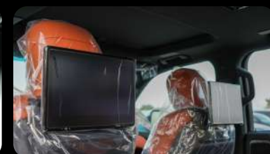
Sistema de Infoentrenamiento Trasero