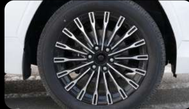
Rines de aleación de 22" pulgadas