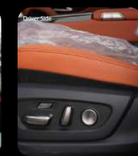
Botones de ajuste eléctrico del asiento