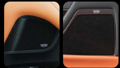
Parlantes Mark Levinson