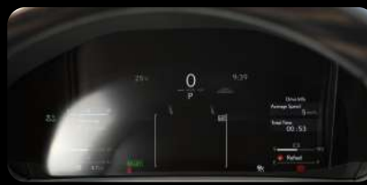
Panel de instrumentos digital