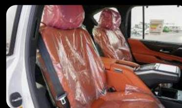
Vista de la segunda fila de asientos