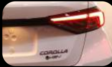
Luz trasera LED