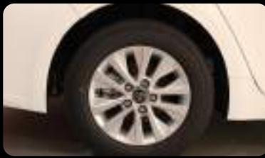
Rines de aleación de 15" pulgadas