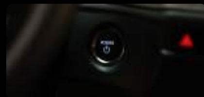
Botón de arranque