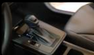
Palanca de cambios