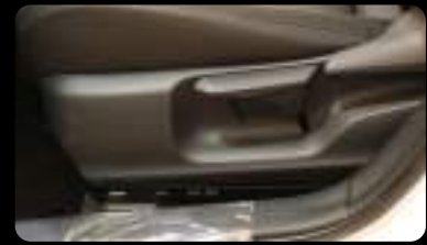
Ajuste del asiento