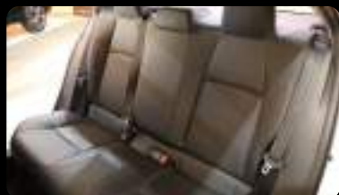
Vista de la segunda fila de asientos