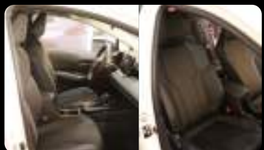
Vista de los asientos delanteros