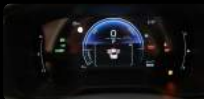
Panel de instrumentos digital