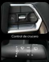
Control de crucero