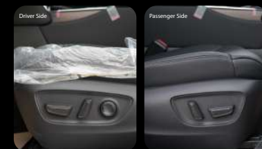
Botones de ajuste eléctrico del asiento