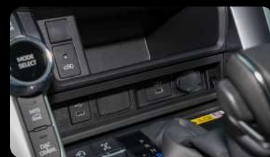
Puertos USB y Carga