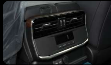
Salida trasera de aire acondicionado con control