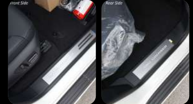
Placa de umbral