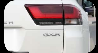
Luz trasera LED