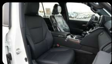
Vista de los asientos delanteros