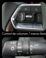
Control de volumen / manos libres