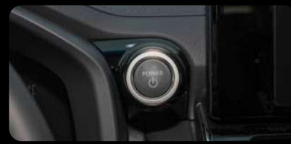
Botón de arranque