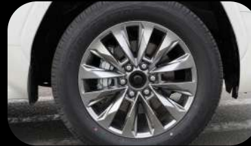
Rines de aleación de 20 pulgadas