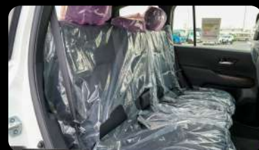
Vista de la segunda fila de asientos