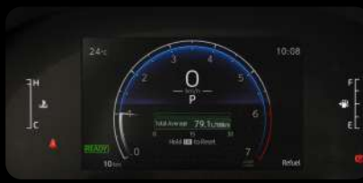
Panel de instrumentos digital