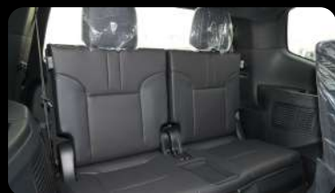
Vista de la tercera fila de asientos