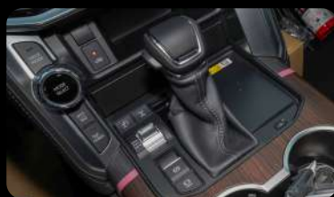
Palanca de cambios, cargador inalámbrico y botones de control