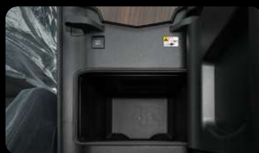
Enfriador de Bebidas