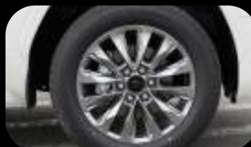
Rines de aleación de 20 pulgadas