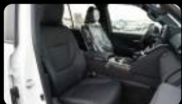
Vista de los asientos delanteros