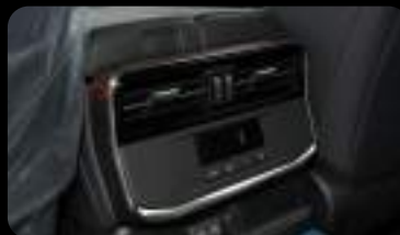
Salida trasera de aire acondicionado con control