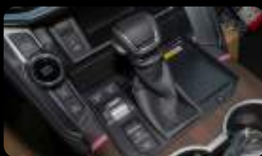
Palanca de cambios, cargador inalámbrico y botones de control