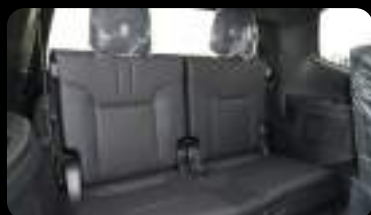
Vista de la tercera fila de asientos