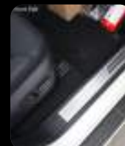
Placa de umbral