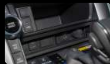
Puertos USB y Carga