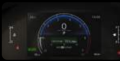
Panel de instrumentos digital