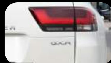
Luz trasera LED