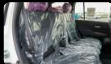
Vista de la segunda fila de asientos