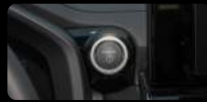
Botón de arranque