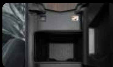
Enfriador de Bebidas