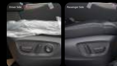
Botones de ajuste eléctrico del asiento