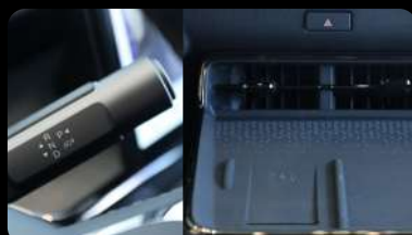
Palanca de cambios y cargador inalámbrico