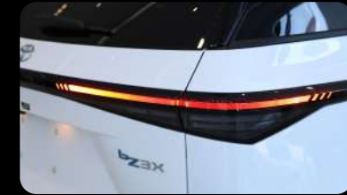
Luz trasera LED