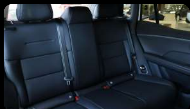
Vista de la segunda fila de asientos