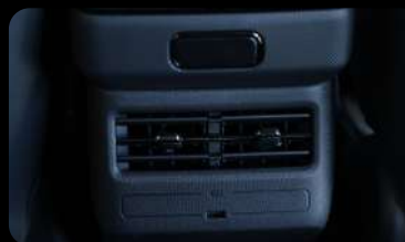
Salida trasera de aire acondicionado y Cargador