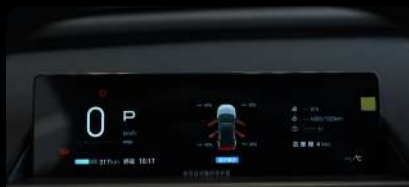
Panel de instrumentos digital