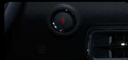
Botón de arranque