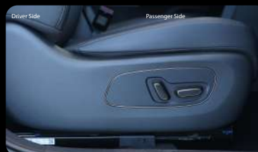
Botones de ajuste eléctrico del asiento