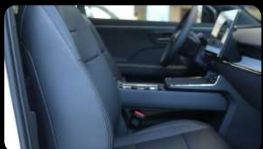
Vista de los asientos delanteros