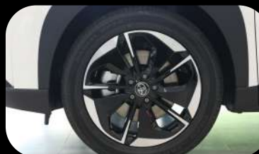
Rines de aleación de 18" pulgadas