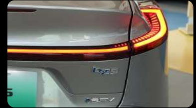
Luz trasera LED