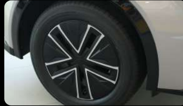
Rines de aleación de 18" pulgadas