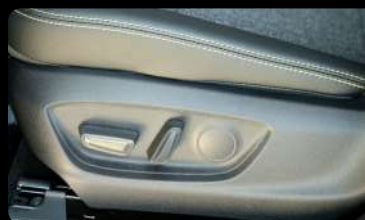
Botones de ajuste eléctrico del asiento