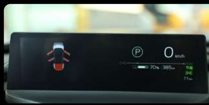
Panel de instrumentos digital