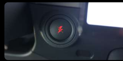
Botón de arranque