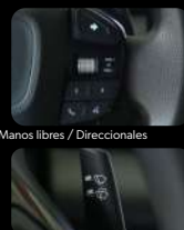
Limpiaparabrisas / lavaparabrisas