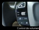
Control de volumen / Manos libres / Direccionales