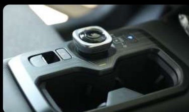
Palanca de cambios