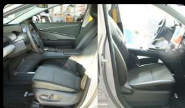
Vista de los asientos delanteros