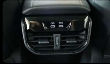
Salida trasera de aire acondicionado y Cargador