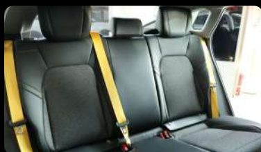
Vista de la segunda fila de asientos