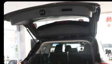
Puertas de atrás