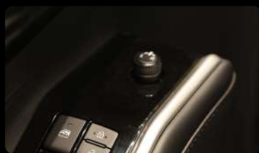
Botones de control de los espejos laterales