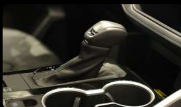
Palanca de cambios