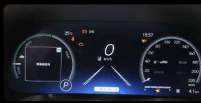
Panel de instrumentos DIGITAL