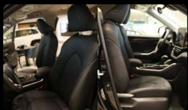
Vista de los asientos delanteros