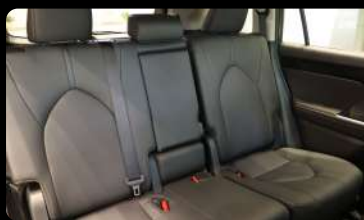
Vista de la segunda fila de asientos