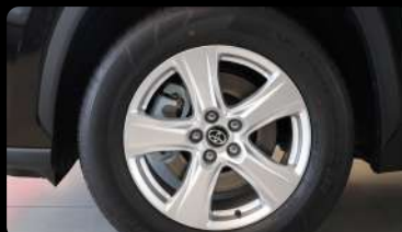
Rines de lujo de 18" pulgadas