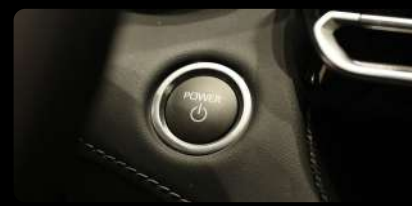
Botón de encendido