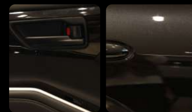
Manija de la puerta